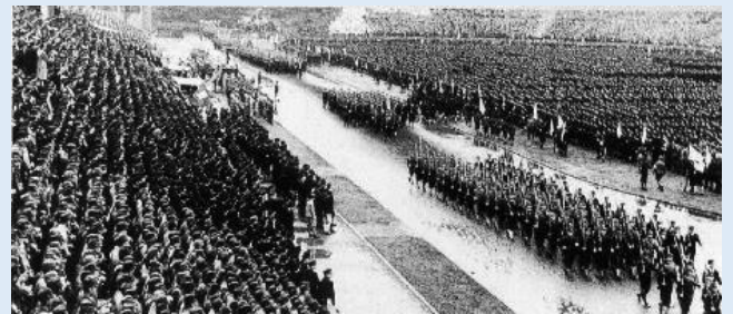
1943年10月21日、雨降る神宮外苑競技場での出 陣学徒壮行会。敗色濃くなる中、東條英機は首相 として学生たちに出陣=死を強要した

1941年10月、戦争内閣の首班となった東條英機は 陸相と併せ国内治安重視の持論から内相も兼務、独裁 の基盤を敷いた。対米英蘭開戦を決めた同年12月1 日の御前会議(天皇臨席の政府・軍首脳会議)では内 相として所管事項を報告、この中には当然ながら外謀 容疑者(スパイ)一斉検挙を含む「戦時特別措置」が あり、よって国家権力冤罪の引き金を引いた。